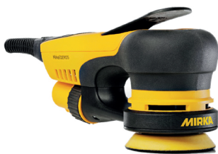
Mirka® DEROS 350CV

Disponible en varias opciones para la reparación eficaz de daños leves .